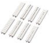
Zackband, bestellbar: streifenweise, weiß, beschriftet nach Kundenangaben, Montageart: verrasten in hoher Schildchennut, für Klemmenbreite: 5,2 mm, Schriftfeldgröße: 5,15 x 10,5 mm

Zackband - ZB 5,LGS:FORTL.ZAHLEN - 1050017