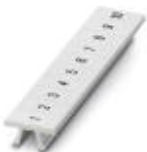
Zackband, Streifen, weiß, beschriftet, längs bedruckt: fortlaufende Zahlen 1-10, 11-20 usw. bis 491-500, Montageart: verrasten in hoher Schildchennut, für Klemmenbreite: 5,2 mm, Schriftfeldgröße: 5,15 x 10,5 mm

Zackband - ZB 5,LGS:FORTL.ZAHLEN - 1050017