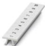
Zackband, Streifen, weiß, beschriftet, längs bedruckt: fortlaufende Zahlen 1-10, 11-20 usw. bis 491-500, Montageart: verrasten in hoher Schildchennut, für Klemmenbreite: 5,2 mm, Schriftfeldgröße: 5,15 x 10,5 mm

Zackband - ZB 5,LGS:FORTL.ZAHLEN - 1050017