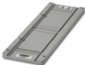
Magazin, für CMS-P1-PLOTTER und PLOTMARK, zur Aufnahme von UC-TMF..., UC1-TMF..., UC-WMT...

Bitte beachten Sie, dass die hier angegebenen Daten dem Online-Katalog entnommen sind. Die vollständigen Informationen und Daten entnehmen Sie bitte der Anwenderdokumentation. Es gelten die Allgemeinen Nutzungsbedingungen für Internet-Downloads. ( http://phoenixcontact.de/download )