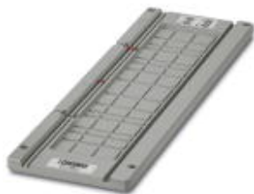
Magazin, für CMS-P1-PLOTTER, zur Aufnahme von UC-WMC 4,4...

Bitte beachten Sie, dass die hier angegebenen Daten dem Online-Katalog entnommen sind. Die vollständigen Informationen und Daten entnehmen Sie bitte der Anwenderdokumentation. Es gelten die Allgemeinen Nutzungsbedingungen für Internet-Downloads. ( http://phoenixcontact.de/download )