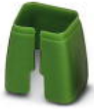
Farbmarkierung für Patch-Kabel, grün

Farbmarkierung - FL PATCH CCODE GN - 2891796