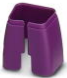
Farbmarkierung für Patch-Kabel, violett

Farbmarkierung - FL PATCH CCODE VT - 2891990