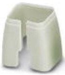
Farbmarkierung für Patch-Kabel, grau

Farbmarkierung - FL PATCH CCODE GY - 2891699