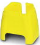
Farbmarkierung für Patch-Kabel, gelb

Farbmarkierung - FL PATCH CCODE YE - 2891592