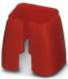
Farbmarkierung für Patch-Kabel, rot

Farbmarkierung - FL PATCH CCODE RD - 2891893