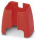
Security-Element für FL Patch Kabel

Security-Element - FL PATCH SAFE CLIP - 2891246