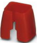
Farbmarkierung für Patch-Kabel, rot

Farbmarkierung - FL PATCH CCODE RD - 2891893