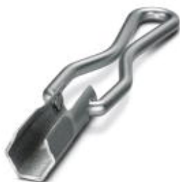
Steckschlüssel, zum Lösen bzw. Festdrehen der QUICKON-Überwurfmutter, Schlüsselweite 15 mm

Bitte beachten Sie, dass die hier angegebenen Daten dem Online-Katalog entnommen sind. Die vollständigen Informationen und Daten entnehmen Sie bitte der Anwenderdokumentation. Es gelten die Allgemeinen Nutzungsbedingungen für Internet-Downloads. ( http://phoenixcontact.de/download )