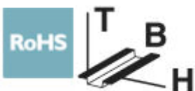
Abbildung zeigt die Variante FLKMS-D37 SUB/S (1-37)

VARIOFACE-Modul, mit Schraubanschluss und D-Subminiatur-Buchsenleiste, zur Montage auf NS 35/7,5 oder NS 32, Polzahl 25