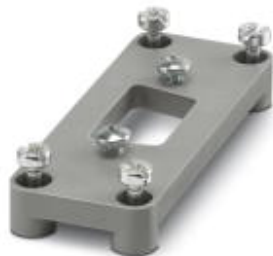
D-SUB-Adapterplatte, zur Bestückung mit einem D-SUB-Stecker, Polzahl 9, Gehäusebaureihe HC-D 15...

Bitte beachten Sie, dass die hier angegebenen Daten dem Online-Katalog entnommen sind. Die vollständigen Informationen und Daten entnehmen Sie bitte der Anwenderdokumentation. Es gelten die Allgemeinen Nutzungsbedingungen für Internet-Downloads. ( http://phoenixcontact.de/download )