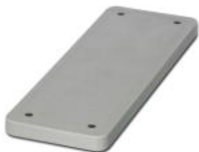
HEAVYCON Abdeckplatte, für Wandausschnitte der Bauform B24, Dicke 7 mm, grau

Bitte beachten Sie, dass die hier angegebenen Daten dem Online-Katalog entnommen sind. Die vollständigen Informationen und Daten entnehmen Sie bitte der Anwenderdokumentation. Es gelten die Allgemeinen Nutzungsbedingungen für Internet-Downloads. ( http://phoenixcontact.de/download )