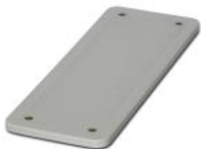
HEAVYCON Abdeckplatte, für Wandausschnitte der Bauform B24/HV16, Dicke 3,5 mm, grau

Bitte beachten Sie, dass die hier angegebenen Daten dem Online-Katalog entnommen sind. Die vollständigen Informationen und Daten entnehmen Sie bitte der Anwenderdokumentation. Es gelten die Allgemeinen Nutzungsbedingungen für Internet-Downloads. ( http://phoenixcontact.de/download )