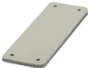
HEAVYCON Abdeckplatte, für Wandausschnitte der Bauform D25, Dicke 3,5 mm, grau

Bitte beachten Sie, dass die hier angegebenen Daten dem Online-Katalog entnommen sind. Die vollständigen Informationen und Daten entnehmen Sie bitte der Anwenderdokumentation. Es gelten die Allgemeinen Nutzungsbedingungen für Internet-Downloads. ( http://phoenixcontact.de/download )