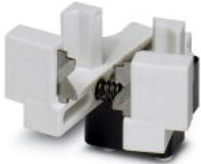
Ersatzmesser für den Abisolier- und Crimpautomat CF 3000-2,5

Bitte beachten Sie, dass die hier angegebenen Daten dem Online-Katalog entnommen sind. Die vollständigen Informationen und Daten entnehmen Sie bitte der Anwenderdokumentation. Es gelten die Allgemeinen Nutzungsbedingungen für Internet-Downloads. ( http://phoenixcontact.de/download )