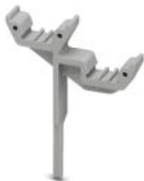
Schildchenträger, grau, unbeschriftet, Montageart: Stecken, Schriftfeldgröße: 4 x 10,5 mm

Bitte beachten Sie, dass die hier angegebenen Daten dem Online-Katalog entnommen sind. Die vollständigen Informationen und Daten entnehmen Sie bitte der Anwenderdokumentation. Es gelten die Allgemeinen Nutzungsbedingungen für Internet-Downloads. ( http://phoenixcontact.de/download )