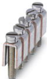
Feste Brücke, Rastermaß: 6,2 mm, Polzahl: 5, Farbe: silberfarben

Bitte beachten Sie, dass die hier angegebenen Daten dem Online-Katalog entnommen sind. Die vollständigen Informationen und Daten entnehmen Sie bitte der Anwenderdokumentation. Es gelten die Allgemeinen Nutzungsbedingungen für Internet-Downloads. ( http://phoenixcontact.de/download )