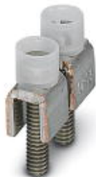
Feste Brücke, Rastermaß: 12 mm, Länge: 7,5 mm, Breite: 21,6 mm, Polzahl: 2, Farbe: silberfarben

Bitte beachten Sie, dass die hier angegebenen Daten dem Online-Katalog entnommen sind. Die vollständigen Informationen und Daten entnehmen Sie bitte der Anwenderdokumentation. Es gelten die Allgemeinen Nutzungsbedingungen für Internet-Downloads. ( http://phoenixcontact.de/download )