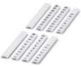
Zackband flach, bestellbar: streifenweise, weiß, beschriftet nach Kundenangaben, Montageart: verrasten in flacher Schildchennut, für Klemmenbreite: 5 mm, Schriftfeldgröße: 5,15 x 5,15 mm

Zackband flach - ZBF 5,LGS:FORTL.ZAHLEN - 0808671