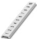
Zackband flach, Streifen, weiß, beschriftet, längs bedruckt: fortlaufende Zahlen 1-10, 11-20 usw. bis 491-500, Montageart: verrasten in flacher Schildchennut, für Klemmenbreite: 5 mm, Schriftfeldgröße: 5,15 x 5,15 mm

Zackband flach - ZBF 5,LGS:FORTL.ZAHLEN - 0808671