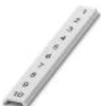
Zackband flach, Streifen, weiß, beschriftet, quer bedruckt: fortlaufende Zahlen 1-10, 11-20 usw. bis 91-100, Montageart: verrasten in flacher Schildchennut, für Klemmenbreite: 5 mm, Schriftfeldgröße: 5,15 x 5,15 mm

Zackband flach - ZBF 5,QR:FORTL.ZAHLEN - 0808697