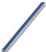
Endlossteckbrücke, Länge: 500 mm, Farbe: blau

Endlossteckbrücke - FBST 500-PLC BU - 2966692