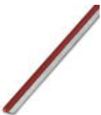
Endlossteckbrücke, Länge: 500 mm, Farbe: rot

Endlossteckbrücke - FBST 500-PLC RD - 2966786