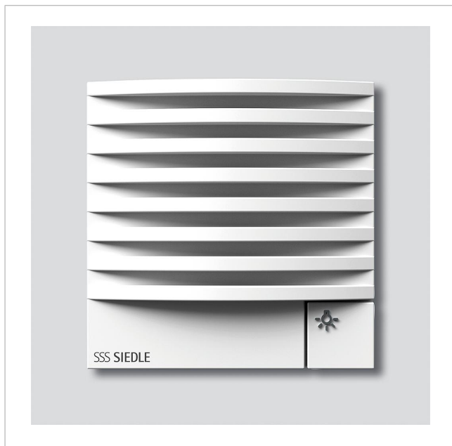
Bus-Türlautsprecher- Modul BTLM 650-04 W 200036816-00