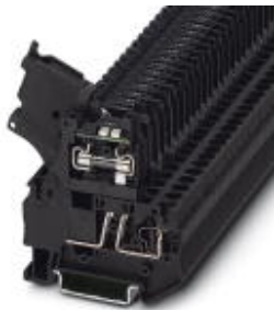
Hebelsicherungsklemme, Farbe schwarz, für 5 x 20 mm G-Sicherungseinsätze, mit LED für 24 V DC

Bitte beachten Sie, dass die hier angegebenen Daten dem Online-Katalog entnommen sind. Die vollständigen Informationen und Daten entnehmen Sie bitte der Anwenderdokumentation. Es gelten die Allgemeinen Nutzungsbedingungen für Internet-Downloads. ( http://phoenixcontact.de/download )