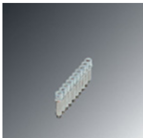
Feste Brücke, Rastermaß: 5,2 mm, Polzahl: 10, Farbe: silberfarben

Bitte beachten Sie, dass die hier angegebenen Daten dem Online-Katalog entnommen sind. Die vollständigen Informationen und Daten entnehmen Sie bitte der Anwenderdokumentation. Es gelten die Allgemeinen Nutzungsbedingungen für Internet-Downloads. ( http://phoenixcontact.de/download )