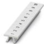
Zackband, Streifen, weiß, beschriftet, längs bedruckt: fortlaufende Zahlen 1-10, 11-20 usw. bis 491-500, Montageart: verrasten in hoher Schildchennut, für Klemmenbreite: 5,2 mm, Schriftfeldgröße: 5,15 x 10,5 mm

Zackband - ZB 5,LGS:FORTL.ZAHLEN - 1050017