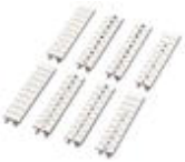
Zackband, bestellbar: streifenweise, weiß, beschriftet nach Kundenangaben, Montageart: verrasten in hoher Schildchennut, für Klemmenbreite: 5,2 mm, Schriftfeldgröße: 5,15 x 10,5 mm

Zackband - ZB 5,LGS:FORTL.ZAHLEN - 1050017