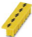
Warnabdeckung, 5-polig, für Klemmenbreite: 5,2 mm