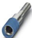
Prüfsteckerbuchse, Farbe: blau

Prüfsteckerbuchse - PSBJ 4/15/6 BU - 0303354