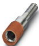
Prüfsteckerbuchse, Farbe: rot

Prüfsteckerbuchse - PSBJ 4/15/6 RD - 0303325