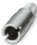
Prüfsteckerbuchse, Farbe: silberfarben