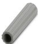
Isolierhülse, Farbe: grau