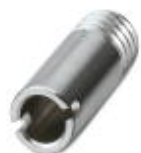
Prüfsteckerbuchse, Farbe: silberfarben