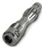
Prüfstecker, Farbe: silber