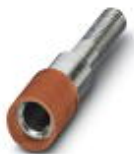
Prüfsteckerbuchse, Farbe: rot

Prüfsteckerbuchse - PSBJ 4/15/6 RD - 0303325