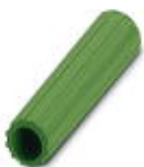
Isolierhülse, Farbe: grün