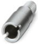
Prüfsteckerbuchse, Farbe: silberfarben