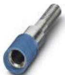
Prüfsteckerbuchse, Farbe: blau

Prüfsteckerbuchse - PSBJ 4/15/6 BU - 0303354