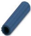
Isolierhülse, Farbe: blau