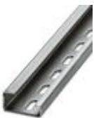
Tragschiene gelocht, G-Profil, Breite: 32 mm, Höhe: 15 mm, nach EN 60715: 2001, Material: Stahl, verzinkt, dickschichtpassiviert, Länge: 2000 mm, Farbe: silber

Tragschiene gelocht - NS 32 PERF 2000MM - 1201002