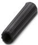
Isolierhülse, Farbe: schwarz