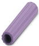
Isolierhülse, Farbe: violett