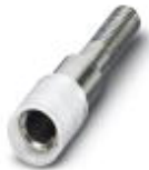
Prüfsteckerbuchse, Farbe: farblos

Prüfsteckerbuchse - PSBJ 4/15/6 FARBLOS - 0303419