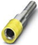
Prüfsteckerbuchse, Farbe: gelb

Prüfsteckerbuchse - PSBJ 4/15/6 YE - 0303367