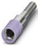
Prüfsteckerbuchse, Farbe: violett

Prüfsteckerbuchse - PSBJ 4/15/6 VT - 0303383