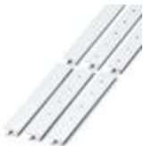
Zackband, bestellbar: streifenweise, weiß, beschriftet nach Kundenangaben, Montageart: verrasten in hoher Schildchennut, für Klemmenbreite: 12,2 mm, Schriftfeldgröße: 10,5 x 12,15 mm

Marker für Klemmen - ZB 12,LGS:L1-N,PE - 0812146