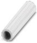
Isolierhülse, Farbe: weiß