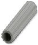
Isolierhülse, Farbe: grau