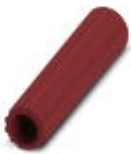
Isolierhülse, Farbe: rot