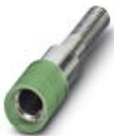
Prüfsteckerbuchse, Farbe: grün

Prüfsteckerbuchse - PSBJ 4/15/6 GN - 0303370