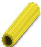
Isolierhülse, Farbe: gelb