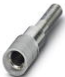
Prüfsteckerbuchse, Farbe: grau

Prüfsteckerbuchse - PSBJ 4/15/6 GY - 0303396