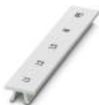
Marker für Klemmen, Streifen, weiß, beschriftet, längs bedruckt: L1, L2, L3, N, PE, Montageart: verrasten in hoher Schildchennut, für Klemmenbreite: 12,2 mm, Schriftfeldgröße: 10,5 x 12,15 mm

Marker für Klemmen - ZB 12,LGS:L1-N,PE - 0812146