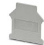
Abschlussdeckel, Länge: 42,5 mm, Breite: 1,5 mm, Höhe: 54 mm, Farbe: grau