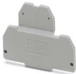
Abschlussdeckel, Länge: 44,2 mm, Breite: 4 mm, Höhe: 34,6 mm, Farbe: grau

Bitte beachten Sie, dass die hier angegebenen Daten dem Online-Katalog entnommen sind. Die vollständigen Informationen und Daten entnehmen Sie bitte der Anwenderdokumentation. Es gelten die Allgemeinen Nutzungsbedingungen für Internet-Downloads. ( http://phoenixcontact.de/download )