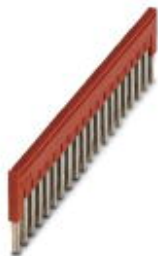
Steckbrücke, Rastermaß: 5,2 mm, Polzahl: 20, Farbe: rot

Bitte beachten Sie, dass die hier angegebenen Daten dem Online-Katalog entnommen sind. Die vollständigen Informationen und Daten entnehmen Sie bitte der Anwenderdokumentation. Es gelten die Allgemeinen Nutzungsbedingungen für Internet-Downloads. ( http://phoenixcontact.de/download )