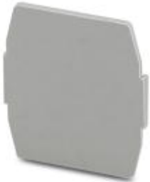
Trennplatte, Länge: 22 mm, Breite: 0,5 mm, Höhe: 22 mm, Farbe: grau

Bitte beachten Sie, dass die hier angegebenen Daten dem Online-Katalog entnommen sind. Die vollständigen Informationen und Daten entnehmen Sie bitte der Anwenderdokumentation. Es gelten die Allgemeinen Nutzungsbedingungen für Internet-Downloads. ( http://phoenixcontact.de/download )