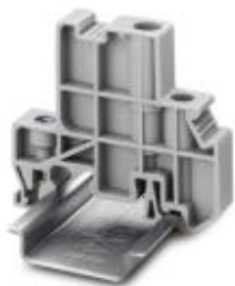
Endhalter, für die Endabstützung von Doppelstock- und Dreistockklemmen, Breite: 10 mm, Farbe: grau

Bitte beachten Sie, dass die hier angegebenen Daten dem Online-Katalog entnommen sind. Die vollständigen Informationen und Daten entnehmen Sie bitte der Anwenderdokumentation. Es gelten die Allgemeinen Nutzungsbedingungen für Internet-Downloads. ( http://phoenixcontact.de/download )