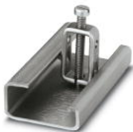
Endhalter, Breite: 8 mm

Bitte beachten Sie, dass die hier angegebenen Daten dem Online-Katalog entnommen sind. Die vollständigen Informationen und Daten entnehmen Sie bitte der Anwenderdokumentation. Es gelten die Allgemeinen Nutzungsbedingungen für Internet-Downloads. ( http://phoenixcontact.de/download )