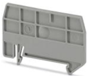
Abteilungstrennplatte, Länge: 59,8 mm, Breite: 2 mm, Höhe: 39 mm, Farbe: grau

Bitte beachten Sie, dass die hier angegebenen Daten dem Online-Katalog entnommen sind. Die vollständigen Informationen und Daten entnehmen Sie bitte der Anwenderdokumentation. Es gelten die Allgemeinen Nutzungsbedingungen für Internet-Downloads. ( http://phoenixcontact.de/download )