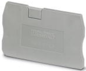
Abschlussdeckel, Länge: 48,6 mm, Breite: 2,2 mm, Höhe: 29,1 mm, Farbe: grau

Bitte beachten Sie, dass die hier angegebenen Daten dem Online-Katalog entnommen sind. Die vollständigen Informationen und Daten entnehmen Sie bitte der Anwenderdokumentation. Es gelten die Allgemeinen Nutzungsbedingungen für Internet-Downloads. ( http://phoenixcontact.de/download )