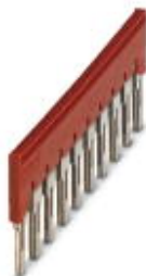
Steckbrücke, Rastermaß: 8,2 mm, Breite: 80,3 mm, Polzahl: 10, Farbe: rot

Bitte beachten Sie, dass die hier angegebenen Daten dem Online-Katalog entnommen sind. Die vollständigen Informationen und Daten entnehmen Sie bitte der Anwenderdokumentation. Es gelten die Allgemeinen Nutzungsbedingungen für Internet-Downloads. ( http://phoenixcontact.de/download )