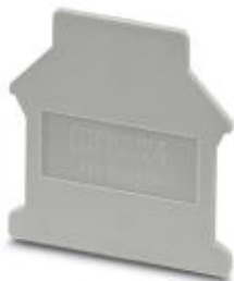
Abschlussdeckel, Länge: 42,5 mm, Breite: 1,5 mm, Höhe: 54 mm, Farbe: grau

Bitte beachten Sie, dass die hier angegebenen Daten dem Online-Katalog entnommen sind. Die vollständigen Informationen und Daten entnehmen Sie bitte der Anwenderdokumentation. Es gelten die Allgemeinen Nutzungsbedingungen für Internet-Downloads. ( http://phoenixcontact.de/download )