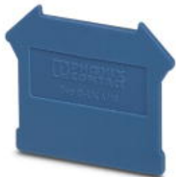
Abschlussdeckel, Länge: 42,5 mm, Breite: 1,8 mm, Höhe: 47 mm, Farbe: blau

Bitte beachten Sie, dass die hier angegebenen Daten dem Online-Katalog entnommen sind. Die vollständigen Informationen und Daten entnehmen Sie bitte der Anwenderdokumentation. Es gelten die Allgemeinen Nutzungsbedingungen für Internet-Downloads. ( http://phoenixcontact.de/download )