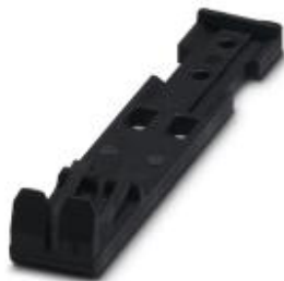
Zugentlastung, Länge: 48,7 mm, Breite: 9,3 mm, Polzahl: 2, Farbe: schwarz

Bitte beachten Sie, dass die hier angegebenen Daten dem Online-Katalog entnommen sind. Die vollständigen Informationen und Daten entnehmen Sie bitte der Anwenderdokumentation. Es gelten die Allgemeinen Nutzungsbedingungen für Internet-Downloads. ( http://phoenixcontact.de/download )