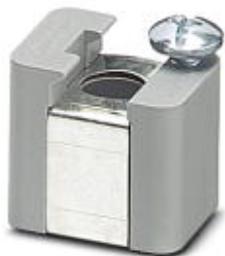
Auflagebock aus Isolierstoff, mit Halteschraube, verwendbar für Sammelschiene 3 x 10 mm, Farbe: grau

Bitte beachten Sie, dass die hier angegebenen Daten dem Online-Katalog entnommen sind. Die vollständigen Informationen und Daten entnehmen Sie bitte der Anwenderdokumentation. Es gelten die Allgemeinen Nutzungsbedingungen für Internet-Downloads. ( http://phoenixcontact.de/download )