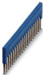
Steckbrücke, Rastermaß: 5,2 mm, Polzahl: 20, Farbe: blau

Bitte beachten Sie, dass die hier angegebenen Daten dem Online-Katalog entnommen sind. Die vollständigen Informationen und Daten entnehmen Sie bitte der Anwenderdokumentation. Es gelten die Allgemeinen Nutzungsbedingungen für Internet-Downloads. ( http://phoenixcontact.de/download )