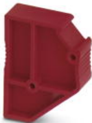
Distanzplatte, Länge: 22,4 mm, Breite: 8,2 mm, Höhe: 29 mm, Polzahl: 1, Farbe: rot

Bitte beachten Sie, dass die hier angegebenen Daten dem Online-Katalog entnommen sind. Die vollständigen Informationen und Daten entnehmen Sie bitte der Anwenderdokumentation. Es gelten die Allgemeinen Nutzungsbedingungen für Internet-Downloads. ( http://phoenixcontact.de/download )