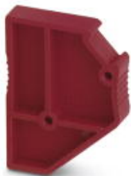
Distanzplatte, Länge: 22,4 mm, Breite: 5,2 mm, Höhe: 29 mm, Polzahl: 1, Farbe: rot

Bitte beachten Sie, dass die hier angegebenen Daten dem Online-Katalog entnommen sind. Die vollständigen Informationen und Daten entnehmen Sie bitte der Anwenderdokumentation. Es gelten die Allgemeinen Nutzungsbedingungen für Internet-Downloads. ( http://phoenixcontact.de/download )