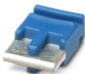
Einzelsteckbrücke, Länge: 6 mm, Polzahl: 2, Farbe: blau

Einzelsteckbrücke - FBST 6-PLC BU - 2966812