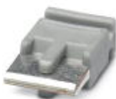
Einzelsteckbrücke, Länge: 6 mm, Polzahl: 2, Farbe: grau

Einzelsteckbrücke - FBST 6-PLC GY - 2966825