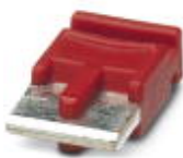
Einzelsteckbrücke, Länge: 6 mm, Polzahl: 2, Farbe: rot

Einzelsteckbrücke - FBST 6-PLC RD - 2966236