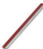
Endlossteckbrücke, Länge: 500 mm, Farbe: rot

Endlossteckbrücke - FBST 500-PLC RD - 2966786