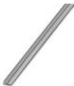
Endlossteckbrücke, Länge: 500 mm, Farbe: grau

Endlossteckbrücke - FBST 500-PLC GY - 2966838