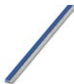
Endlossteckbrücke, Länge: 500 mm, Farbe: blau

Endlossteckbrücke - FBST 500-PLC BU - 2966692