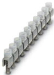
Feste Brücke, Rastermaß: 12 mm, Länge: 7,5 mm, Breite: 118,4 mm, Polzahl: 10, Farbe: silberfarben

Bitte beachten Sie, dass die hier angegebenen Daten dem Online-Katalog entnommen sind. Die vollständigen Informationen und Daten entnehmen Sie bitte der Anwenderdokumentation. Es gelten die Allgemeinen Nutzungsbedingungen für Internet-Downloads. ( http://phoenixcontact.de/download )