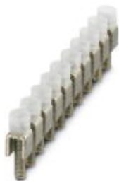
Feste Brücke, Rastermaß: 10,2 mm, Polzahl: 10, Farbe: silberfarben

Bitte beachten Sie, dass die hier angegebenen Daten dem Online-Katalog entnommen sind. Die vollständigen Informationen und Daten entnehmen Sie bitte der Anwenderdokumentation. Es gelten die Allgemeinen Nutzungsbedingungen für Internet-Downloads. ( http://phoenixcontact.de/download )