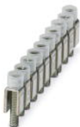
Feste Brücke, Rastermaß: 6 mm, Polzahl: 10, Farbe: silberfarben

Bitte beachten Sie, dass die hier angegebenen Daten dem Online-Katalog entnommen sind. Die vollständigen Informationen und Daten entnehmen Sie bitte der Anwenderdokumentation. Es gelten die Allgemeinen Nutzungsbedingungen für Internet-Downloads. ( http://phoenixcontact.de/download )