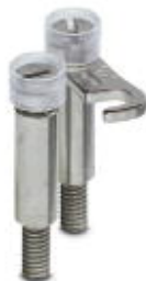
Schaltbrücke, Rastermaß: 13 mm, Polzahl: 2, Farbe: silberfarben

Bitte beachten Sie, dass die hier angegebenen Daten dem Online-Katalog entnommen sind. Die vollständigen Informationen und Daten entnehmen Sie bitte der Anwenderdokumentation. Es gelten die Allgemeinen Nutzungsbedingungen für Internet-Downloads. ( http://phoenixcontact.de/download )