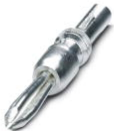
Prüfstecker, mit Lötanschluss bis 1 mm 2 Leiterquerschnitt, Farbe: silber

Bitte beachten Sie, dass die hier angegebenen Daten dem Online-Katalog entnommen sind. Die vollständigen Informationen und Daten entnehmen Sie bitte der Anwenderdokumentation. Es gelten die Allgemeinen Nutzungsbedingungen für Internet-Downloads. ( http://phoenixcontact.de/download )