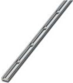
Querverbindungsschiene, für feste Brückung gleicher Ein- oder Ausgänge, aus Cu, vernickelt, 1 m lang

Bitte beachten Sie, dass die hier angegebenen Daten dem Online-Katalog entnommen sind. Die vollständigen Informationen und Daten entnehmen Sie bitte der Anwenderdokumentation. Es gelten die Allgemeinen Nutzungsbedingungen für Internet-Downloads. ( http://phoenixcontact.de/download )