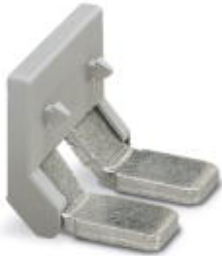
Einlegebrücke, Rastermaß: 25 mm, Polzahl: 2, Farbe: grau

Bitte beachten Sie, dass die hier angegebenen Daten dem Online-Katalog entnommen sind. Die vollständigen Informationen und Daten entnehmen Sie bitte der Anwenderdokumentation. Es gelten die Allgemeinen Nutzungsbedingungen für Internet-Downloads. ( http://phoenixcontact.de/download )